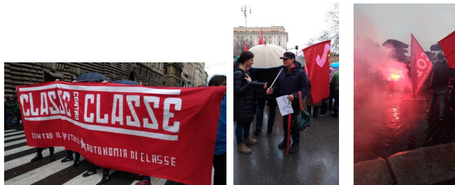
Mancano altre foto a titolo di esempio scelte 3 foto a caso.

Questo articolo è stato pubblicato in Senza categoria da federazionebuscamion . Aggiungi il permalink ai segnalibri.