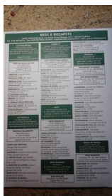
CAF, INAC. Tramite il Sindacato F.C.C.O., PCL "Para Cobas pro Lavoratori".

Assistenza fiscale per i lavoratori subordinati in tutte le regioni e provincie d'Italia CAI,